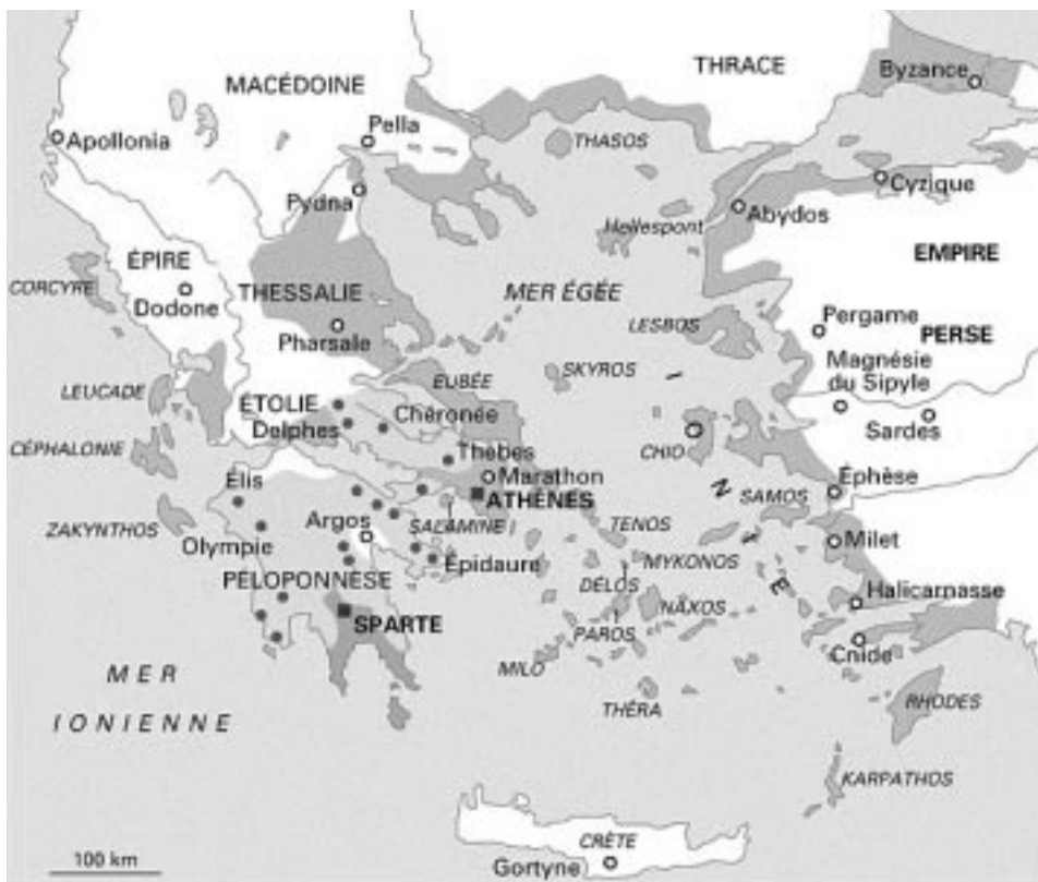
Fig 1. La Grèce au temps d'Hippocrate. N'est pas représentée, la " Grande Grèce " comprenant le sud de l'Italie et la Sicile.

Périclès fait réaliser de grands travaux au Pirée qui sert de port à Athènes pour le fortifier, à l'Acropole qu'il fait rénover et agrandir avec magnificence. Ces énormes dépenses l'obligent à puiser dans les caisses, à faire