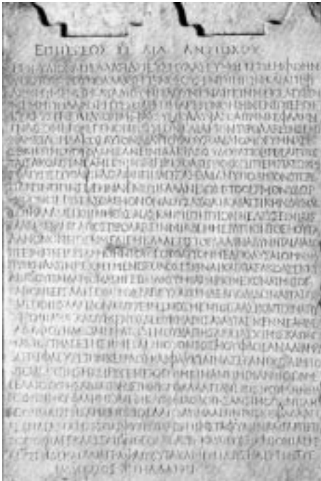
Fig 4. Stèle qui rappelle la guérison de M. Julius Appella qui avait été soigné à Epidaure. (Musée d'Epidaure).

C'est en Thessalie que se situa le premier sanctuaire dédié à Asclépios mais c'est à Epidaure en Argolide, dans le Nord-est du Péloponnèse que le culte fit d'Asclépios un demi-Dieu au cours du VI e siècle av JC. La ville d'Epidaure s'appropriait Asclépios en le faisant naître en ce lieu comme tente de le faire croire Isyllos, poète du III e siècle av. JC qui écrit un hymne à la gloire du demi-dieu.