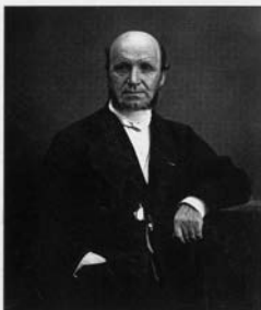
Fig. 1. - G.-B. Duchenne de Boulogne. Photo de Nadar vers 1869. Arch. phot. Paris, CNMHS.

En 1851, il définit la paralysie saturnine, l'atrophie musculaire progressive, la paralysie atrophique de l'enfance, les paralysies générales spinales et l'ataxie locomotrice. Il décrira surtout plus spécialement la paralysie pseudo-hypertrophique qui sera connue sous le nom de maladie de Duchenne de Boulogne. Reconnu et honoré par ses pairs, il reçoit de nombreux prix, la Légion d'Honneur et sera membre de la Société de Médecine de Paris. (fig. 1)