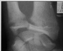
Fig 1. Les cartilages de croissance sont élargis au niveau du poignet.