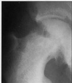
Fig 7. La fusion sera obtenue sans difficulté.

laisse l'impression qu'il n'y a plus de contact entre le col et la tête fémorale.