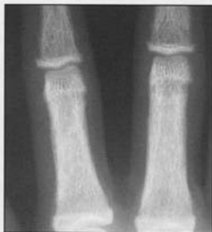
Fig 3. ...comme les phalanges qui témoignent d'une ostéopénie.