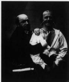
Fig. 3. Simulacre du rire naturel. Inv Ensba : PC 4366.

Duchenne fit toute une série de découvertes sur la motricité de la main, sur l'action du diaphragme, des muscles intercostaux, des muscles spinoux, abdominaux... On lui doit aussi une clarification des mécanismes de synergie fonctionnelle entre les divers groupes musculaires.