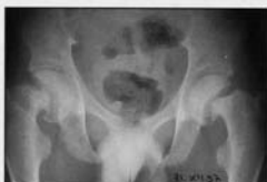
Fig 4. La radiographie des hanches montre une épiphysyolyse.