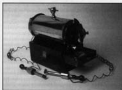
Fig. 2. - « La Bobine de Duchenne ». Paris Musée d'Histoire de la Médecine.

Duchenne de Boulogne tient dans l'histoire de la médecine, une place éminente : « le petit vieux avec sa boîte à malices », comme l'appelaient gentiment les vieilles pensionnaires des divisions de la Salpêtrière, a ouvert une voie qui ne cesse, surtout depuis un demi-siècle, de s'élargir. Le champ des maladies neuro-musculaires qu'il a largement contribué à définir est aujourd'hui le lieu de recherches et d'innovations thérapeutiques qui font l'honneur de la médecine moderne.