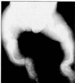
Forme grave d'Ostéogénèse Imparfaite.

Les familles de patients atteints d'Ostéogénèse Imparfaite étaient jadis confrontées à de multiples avis et ballottées dans de nombreuses consultations. Nous essayons actuellement de regrouper l'ensemble des bilans, de réaliser une évaluation